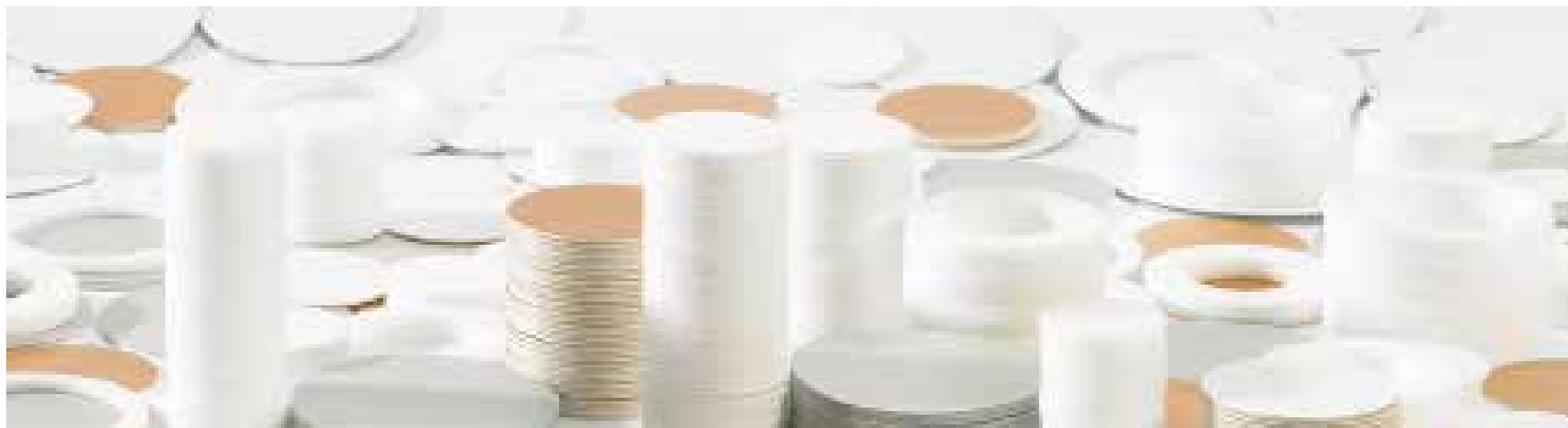
Meyer Seals produziert Dichteinlagen für Kunststoff- und Aluminiumverschlüsse.