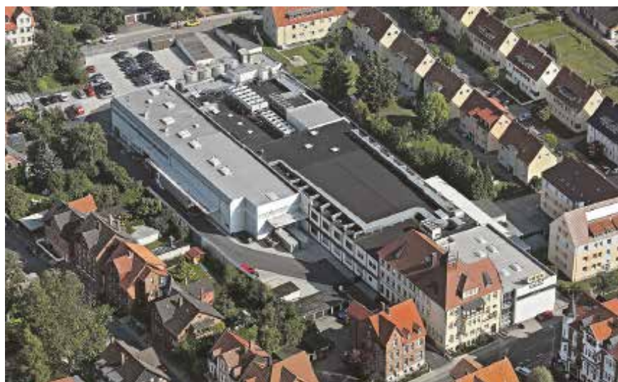
Der Alfelder Standort an der Hildesheimer Straße von oben.