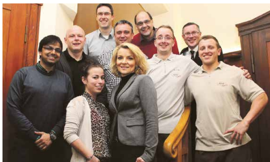
Ein Teil des internationalen Teams von Meyer Seals.